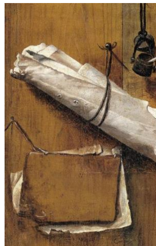
Fragmento de Marcos Correa, Trampantojo (Hispanic Society of America)

(Descripción de la signatura Varios en la BNE)